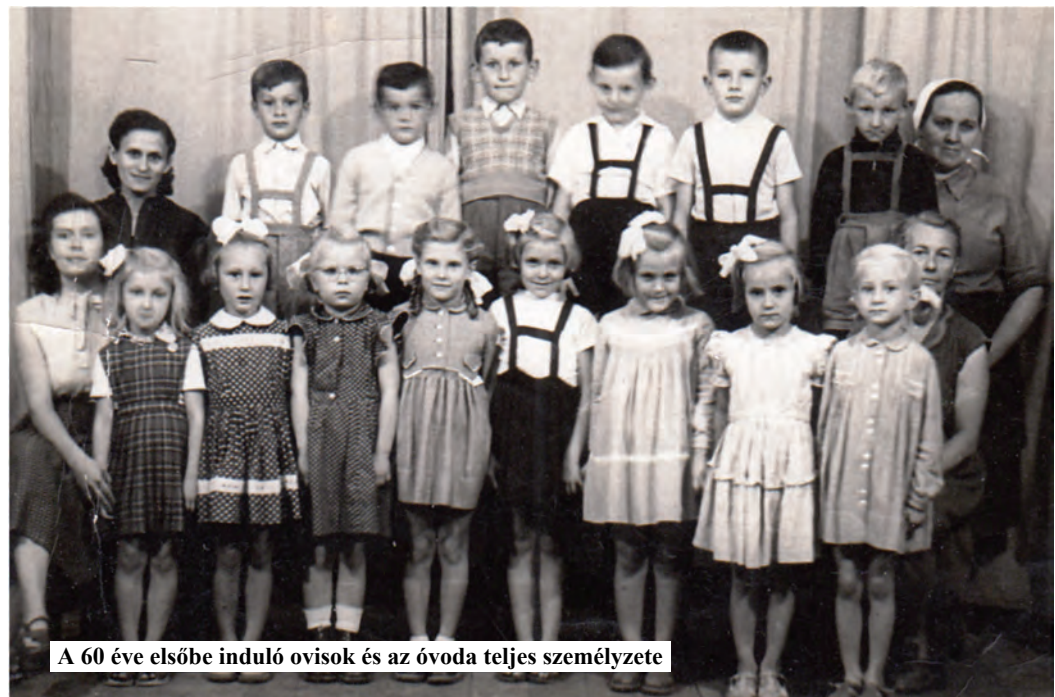
A 60 éve elsőbe induló ovisok és az óvoda teljes személyzete

S olyan természetes, olyan jó volt. Hiába a világ sok furcsa forgása, mégiscsak kell a gyökér, kell a visszatérés, az összehajlás, ezt kívánja az emberi természet, ezt a meghittséget.