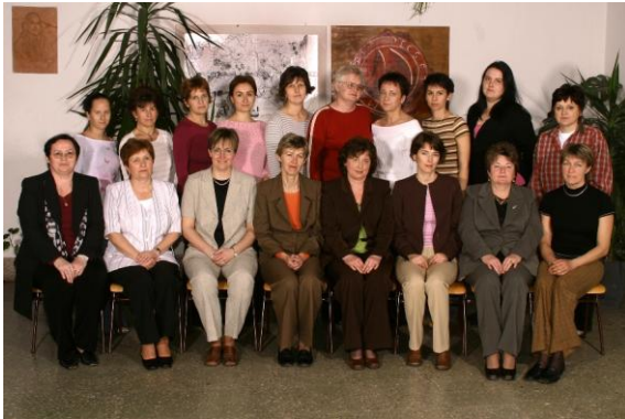
A 2005/2006. tanév tantestülete

Ünnepeket rendeznek a tanárévacsák és a tanárnénik. Szépek a könyvtárban a könyvek. Azért is szeretek iskolába járni, mert olvasom.